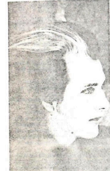
● DAVE VANIAN (The Damned) «Penso che innamorarsi veramente sia una cosa che capita a pochi, ma capita. Lo so con perfezza perché è successo anche a me».

GIRL GOES DOWN L.A. WOMAN SHASH IT UP ELOISE PLAN 9 STREET OF DREAMS NEAT NEAT NEAT BACK DOOR MAN TONITE LOVE SONG WE LUV U